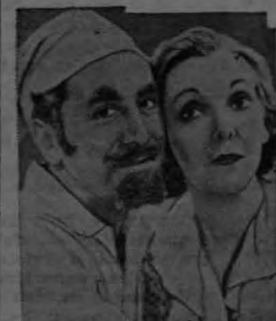
JACK PEARL and ZASU PITTS in "MEET THE BARON"

Para mañana, anuncia nada menos que el remedio contra todos los males, la bebida contra todas las penas, el elixir contra todas las tristezas. JIMMY DURANTE, el cómico impar, el ídolo de nuestro públi-